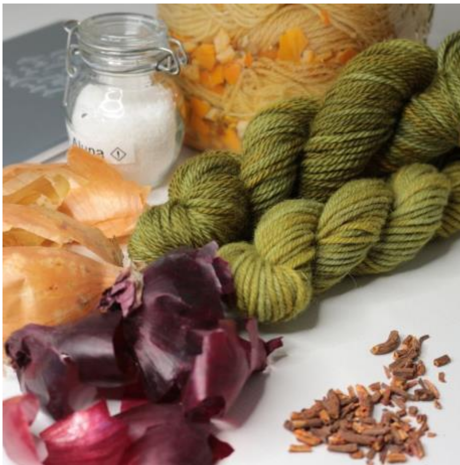
Kuva 3. Purkkivärjäyksen mainosmateriaalia.

Vuoden 2022 käsityötekniikka luonnonväreillä värjääminen näkyi monipuolisesti yhdistyksen toiminnassa. Purkkivärjäyksen avulla oli helppo tutustua tekniikkaan. Purkkivärjäyksestä oli tarjolla lyhytkursseja, myymälässä myytiin värjäysmateriaaleja sekä valmiita koottuja purkkeja ohjeineen. Käsityökoulu Peukun puolella tutustuttiin vuoden käsityötekniikkaan myös purkkivärjäyksen kautta. Taitokeskuksessa oli tarjolla aiheeseen liittyvää materiaalia ja aiheeseen liittyen sai neuvontaa. Järjestimme vuoden aikana myös purkkivärjäystöpajoja mm. Sadonkorjuumarkkinoilla Rovaniemen Kotiseutumuseolla sekä Elsa Montell -näyttelyyn liittyen Arktikumilla.