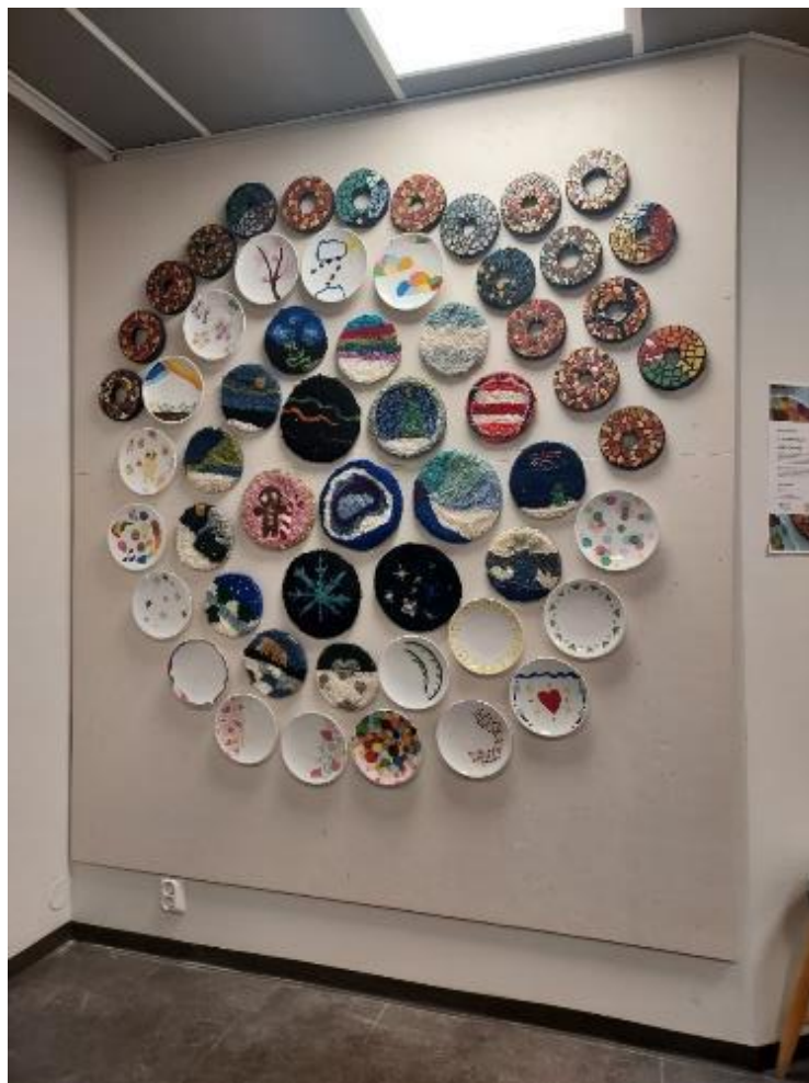
Kuva 4 Käsityökoulu Peukun lasten ja nuorten oppilastyönäyttely Taitokeskuksen kahvitilassa joulukuussa.