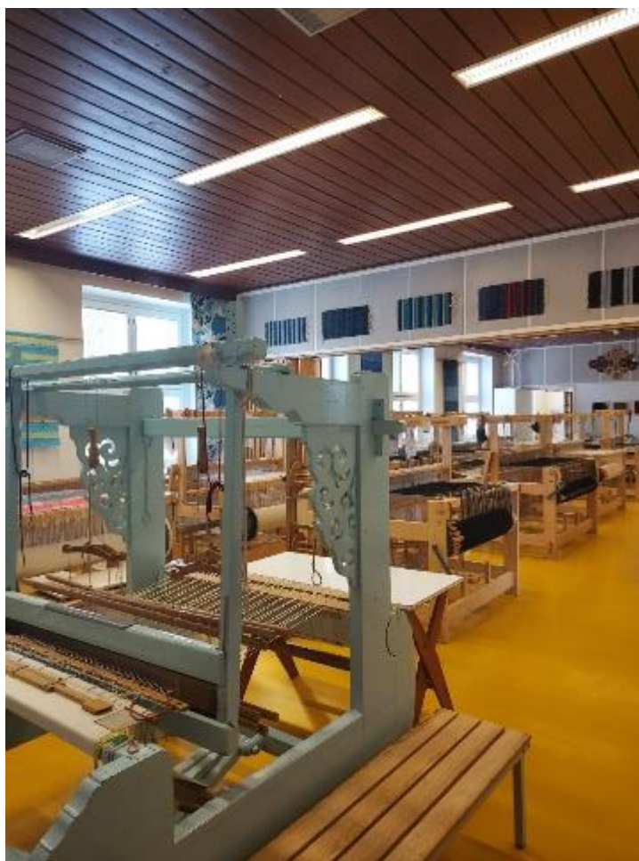
Kuva 1. Pellon Taitokeskus.

Taitokeskuksemme ovat erikoistuneet seuraaville osaamisalueille: