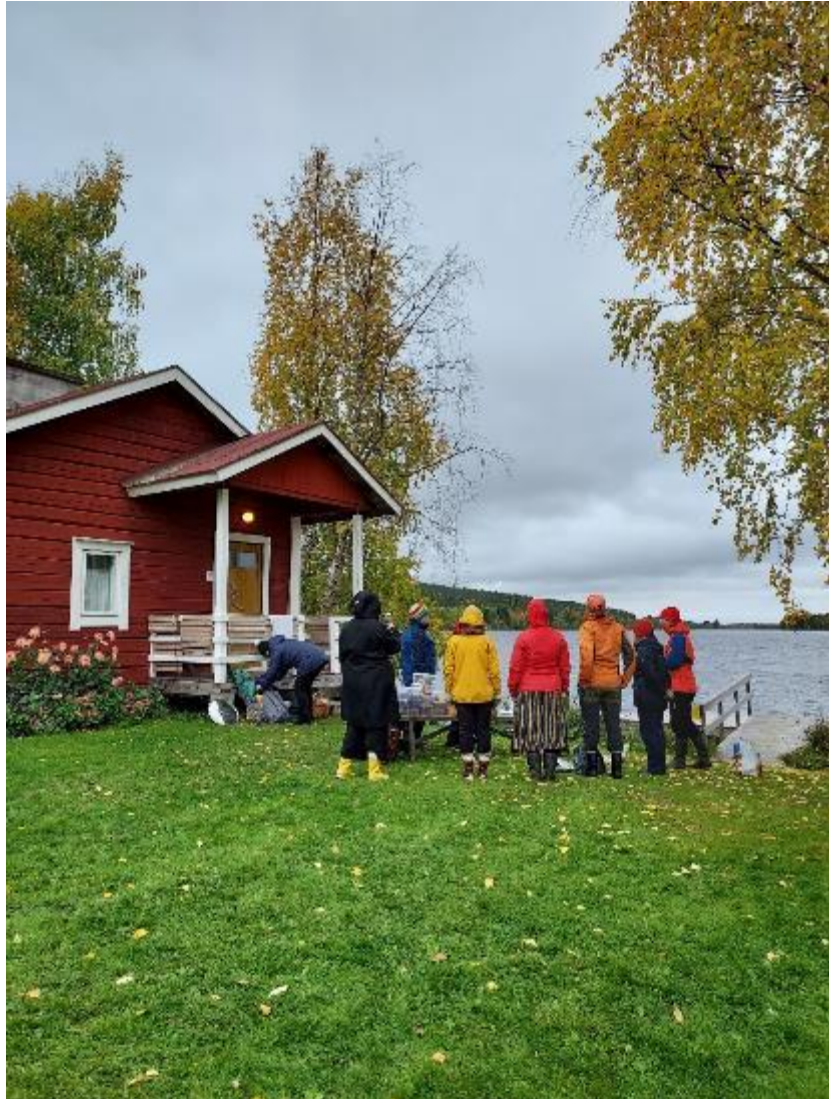
Kuva 9 Sienivärjyskurssin kurssilaiset tutustumassa kasvivärjäyksen ihmeelliseen maailmaan.

Hankkeen tuloksena saatiin arvokasta tietoa luontolähtöisistä palveluista hankkeeseen määritellyille kohderyhmille. Hankkeessa tehtiin yhteistyöavauksia ei tahojen kanssa, joka mahdollistaa myös tulevaisuudessa uudenlaisia testausmahdollisuuksia.