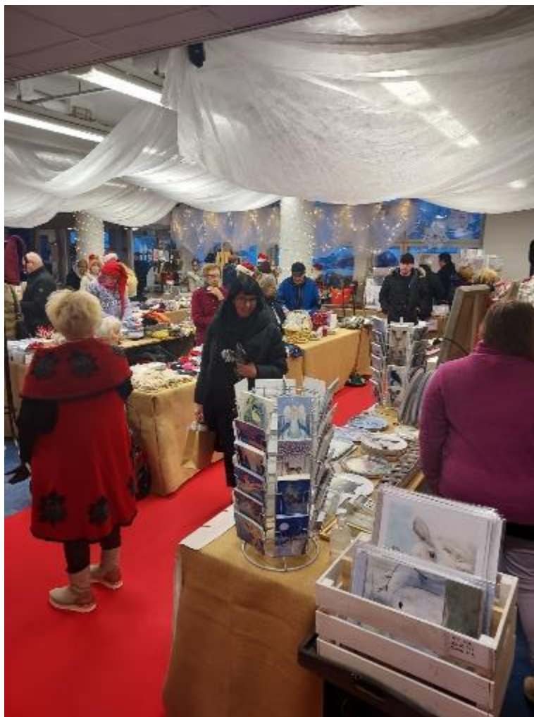
Kuva 8 Tunnelmia Taitava Lappi -joulumarkkinoilta vanhalta Postitalolta.