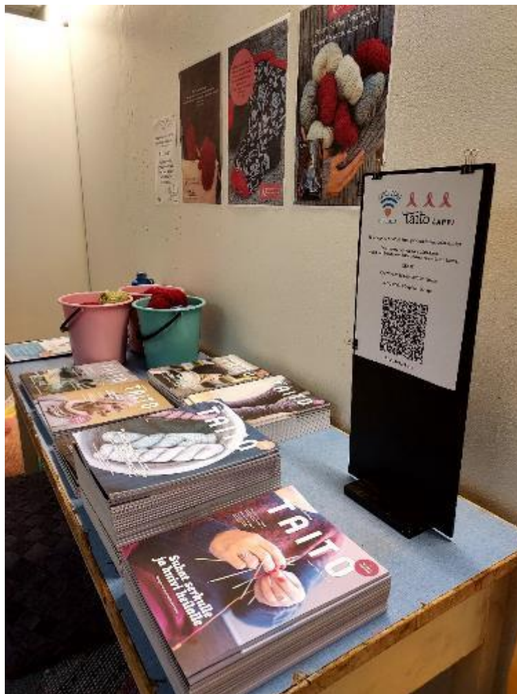
Kuva 7 Roosa-nauha -tempauspäivän materiaalia 7.10.2022.