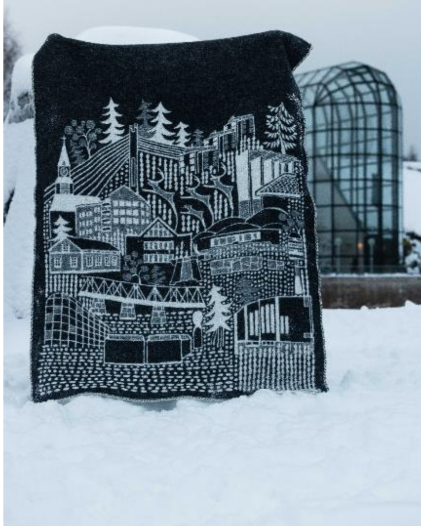
Kuva 6 Rovaniemi-huopa kuvattuna Arktikumin rannassa.